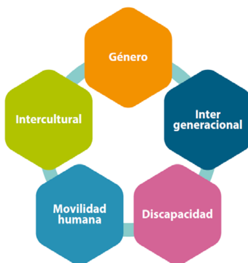
Gráfico Nro. 1

Nota: Tomado de Guía para la formulación de políticas públicas sectoriales, por Secretaría Nacional de Planificación y Desarrollo, 2011.