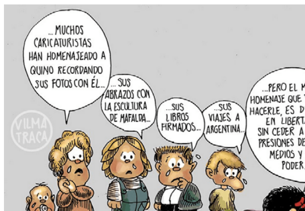
Imagen Nro. 2

Como herramienta permite expresar sin pena lo que se piensa y en algunos casos es la que, a partir de un error, produce una obra visual que, como en una metamorfosis, puede convertirse en algo bello para el espectador o transformar los defectos del ser humano en virtudes. De esta manera, la caricatura es vista como una labor en la que un dibujante plasma mediante el trazo sobre el papel su perspectiva de la persona, los aspectos que configuran su identidad y su contexto. A su vez, es un arte condicionado por lo inmediato y lo impredecible, es decir, el dibujante crea en el momento, sobre el tiempo, sin ser consciente del resultado. De igual modo, es un producto que, una vez en manos de su receptor, escapa del artista que lo crea (Bayona, 2019, p. 45).