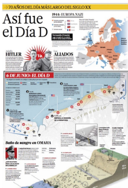
Imagen Nro. 1

“Es una combinación de elementos visuales que aporta un despliegue gráfico de la información. Se utiliza fundamentalmente para brindar una información compleja mediante una presentación gráfica que puede sintetizar o esclarecer o hacer más atractiva su lectura” (Clarín, 1997, p. 157). “Esta técnica produce nuevos parámetros de producción que permiten optimizar y agilizar los procesos de comprensión basándose en una menor cantidad y una mayor precisión de la información, anclada en la imagen y el texto” (Minervini, 2005, p. 2). “Es la representación visual que resume o explica alguna información mediante secuencias expositivas, argumentativas o narrativas o, incluso, interpretaciones presentadas de manera gráfica o esquemática, lo que la hace dinámica, atractiva y fácil de asimilar” (Castillo, Vallín, Suárez, 2017, p. 1).