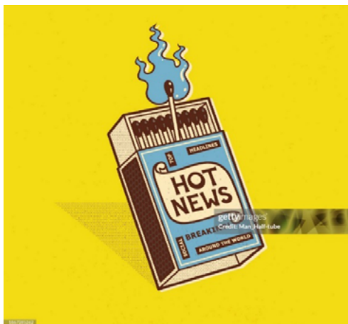
Imagen Nro. 3