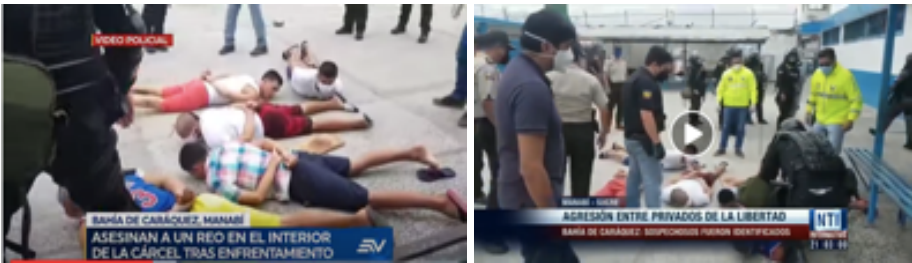
Imagen 2. Noticia de riña y asesinato en cárcel

Cabe resaltar que en la información analizada no se presentaron casos de prácticas periodísticas que vulneren los derechos de las víctimas, de los menores de edad y los derechos de protección de identidad. La narrativa y el uso de imágenes entre los dos medios utiliza recursos similares para ejemplificar la noticia. Sin embargo, se recomienda la vigilancia a las acciones de los agentes del Estado, que no caigan en excesos o violen las leyes y los derechos humanos (Imagen 2).