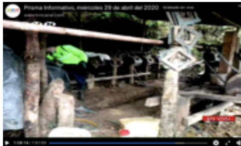
Imagen 3. Noticia sobre delito minero