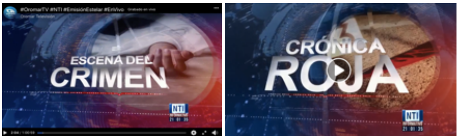
Tabla 3. Resultados de análisis de sentimiento. Titulares - Crónica roja

La información de violencia presentada según el criterio editorial Tomar postura en contra del entorno , es decir, “condenar y rechazar la violencia motivada por la delincuencia organizada, enfatizar en el impacto negativo que tiene en la población y fomentar la conciencia social en contra de la violencia”, los medios lo cumplen, en razón de que, en sus relatos no justifican bajo ninguna circunstancia el crimen organizado y el terrorismo. Sin embargo, la utilización de imágenes para la inducción a las noticias de crónica roja con títulos como Escena del crimen (Imagen 1) denota espectacularización. “Lo espectacular de la imagen le puede garantizar un lugar en los imaginarios individuales y colectivos, lo cual no solo depende solo de los individuos, sino también de la intencionalidad de los medios de comunicación” (Córdoba Laguna, 2018:103).