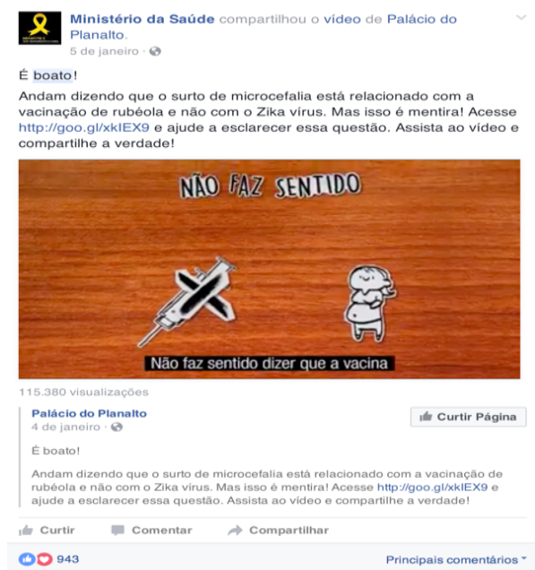
Figura 4 - Post del Ministerio de Salud en Facebook sobre boato referente a daños neurológicos en niños y ancianos (2 febrero 2016)