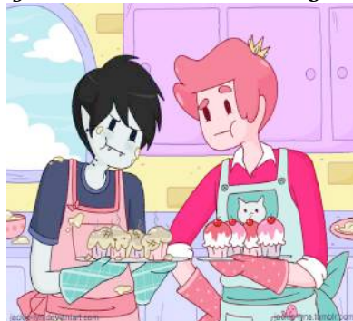
Gráfico 3: Fanarts cambio de género