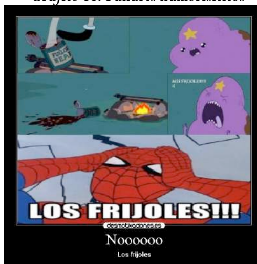
Gráfico 11: Fanarts humorísticos