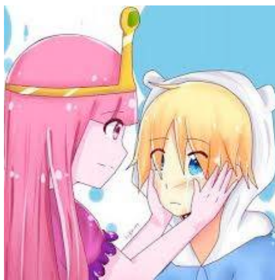
Gráfico 4: Parejas nuevas