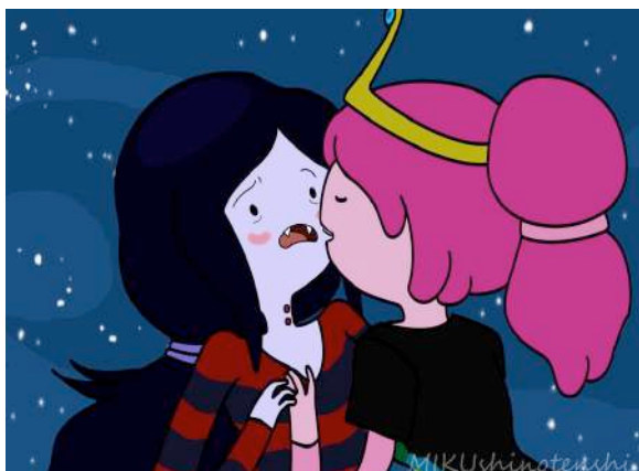
Gráfico 5: Parejas nuevas homosexuales