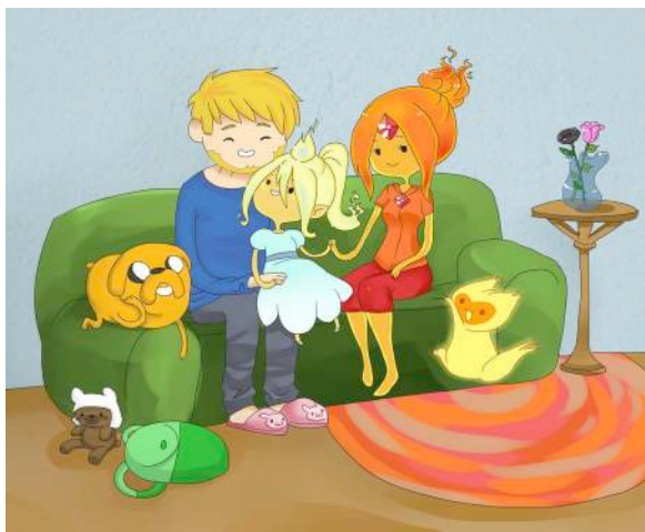
Gráfico 8: Expansión narrativa: forward