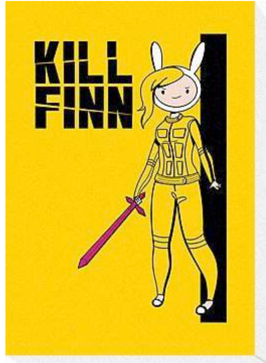
Gráfico 1: Fanarts Intertextuales