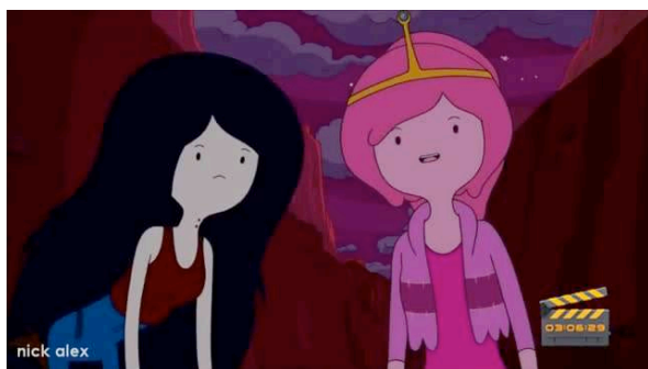
Gráfico 2: Dulce Princesa y Marceline