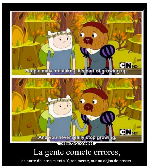
Gráfico 10: Fanarts reflexivos-motivacionales