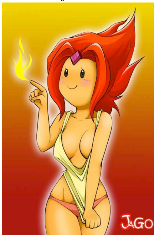
Gráfico 7: Eróticos