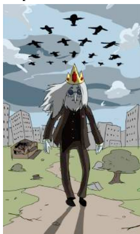
Gráfico 9: Expansión narrativa: flashback