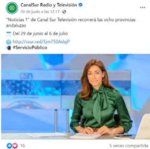
Imagen 5. Publicación en Facebook de Canal Sur relativa a un anuncio de sus servicios informativos