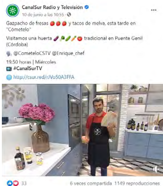
Imagen 4. Publicación en Facebook de Canal Sur sobre un programa de cocina