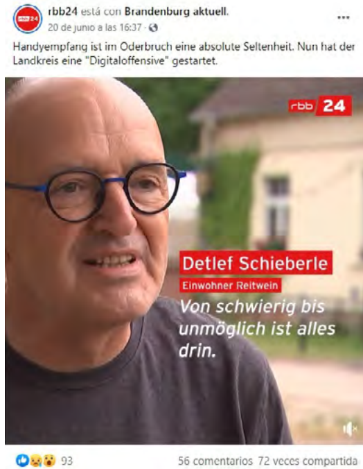
Imagen 7. Publicación en Facebook de RBB24 sobre falta de cobertura móvil en Brandeburgo