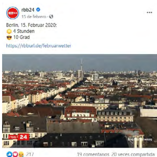
Imagen 6. Publicación en Facebook de RBB24 sobre la situación meteorológica