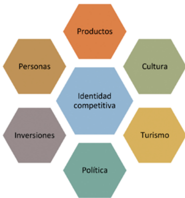
Figura 1. Canales básicos de la «identidad competitiva»

Fuente: elaboración propia. Adaptado de Anholt (2009a: 209).