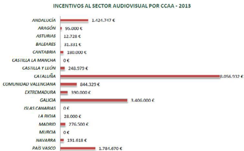
Figura 1. Incentivos al sector audiovisual en 2013 por Comunidades Autónomas.

Lo cierto es que se está produciendo un descenso generalizado de la facturación de las empresas que se dedican al audiovisual en España, con una concentración de producciones audiovisuales en Cataluña y Madrid, que suponen casi el 80% del total.