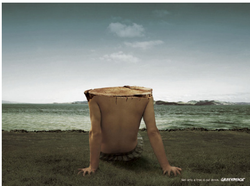
Figura 4. Pieza publicitaria "Not only a tree is cut down".