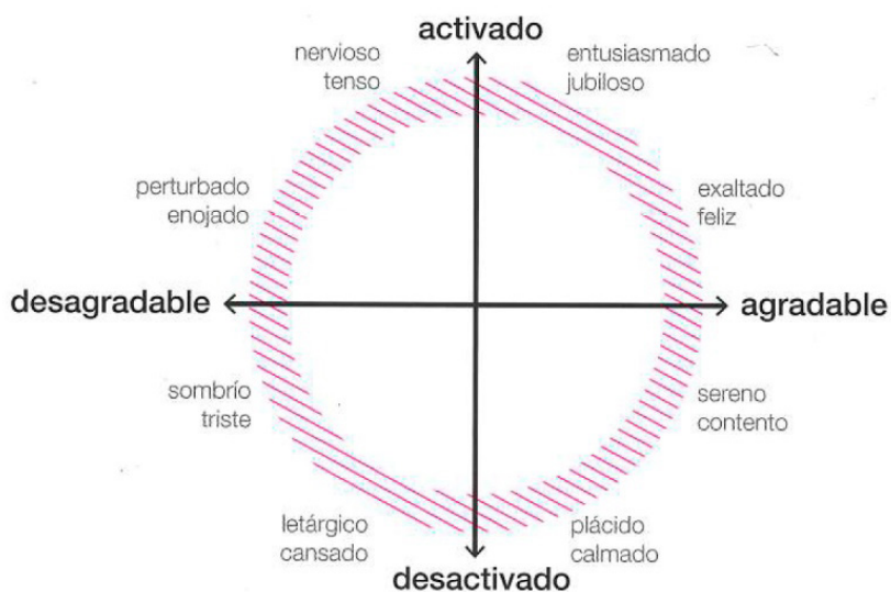
Figura 1. Modelo circumplejo de afecto

Modelo circumplejo del afecto: según Russel (2003), "el afecto nuclear es un estado neurofisiológico accesible conscientemente como un sentimiento simple no reflectante, que es una mezcla integral de valores hedónicos (placer-desagrado) y de excitación (somnolencia-activación)". Este modelo está basado en la siguiente figura de naturaleza cartesiana: