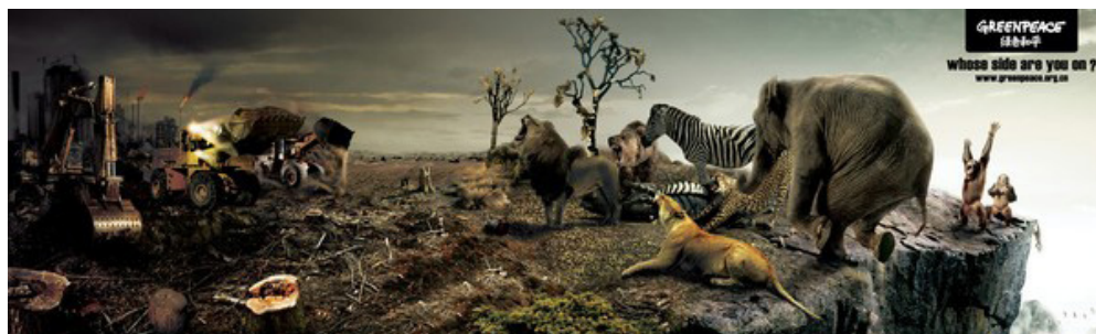
Figura 3. Pieza publicitaria "Whose side are you on?"

El análisis sígnico llevó a seleccionar elementos con alta carga simbólica, que se tomaron como guía para ser traducidos en tecnología de realidad aumentada sin alterar el sentido del mensaje publicitario original, pero que pudiesen ser interpretados por medio de la tecnología mencionada. En este sentido se aplicó el instrumento de evaluación desde los conceptos semióticos (véanse las tablas ubicadas en el marco metodológico) que fueron tomados en cuenta para el desarrollo de la presente investigación. A continuación, se presentan las imágenes seleccionadas para el desarrollo de las traducciones, acompañadas de sus respectivas matrices de análisis.