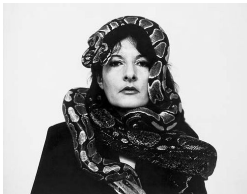
Fig. 7. Marina Abramovic, Dragon Heads performance, video, 1993.