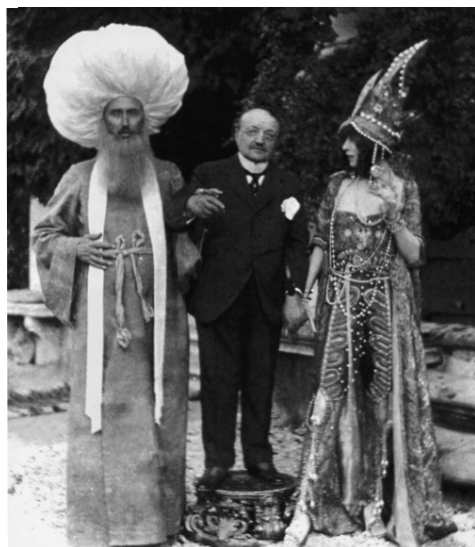
Fig. 8. Paul-César Helleu, G Boldini y L. Casati vistiendo el vestido Indio-persa en el jardín del Palacio de Leoni, fotografía de Mariano Fortuny, 1913.