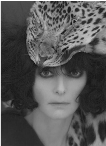
Fig. 2. Tilda Swinton.