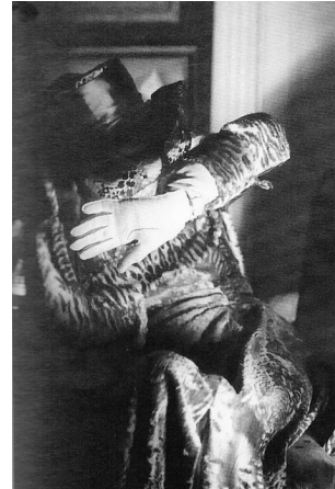
Fig. 11. Luisa Casati por Cecil Beaton, 1954.