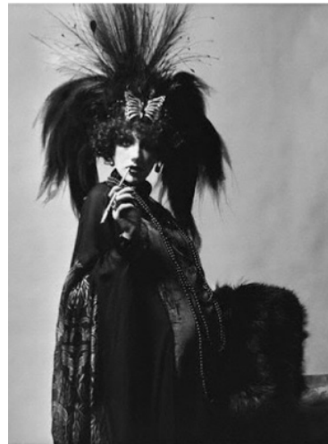
Fig. 3. Marisa Berenson vestida como la Marquesa para Rothschild Ball, 1972.