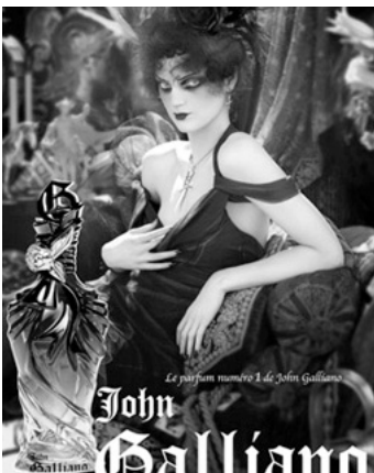
Fig. 4. John Galliano para Christian Dior Couture.