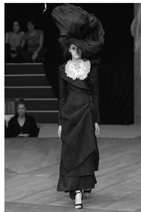
Fig. 5. Alexander McQueen.