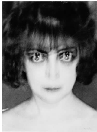
Fig. 12. Man Ray, 1922.