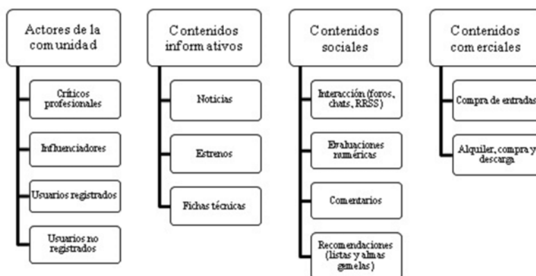
Figura 1. Variables de análisis de la comunidad de cine Filmaffinity

Para el estudio del caso Filmaffinity identificamos cuatro variables de análisis en función del contenido y de las opciones que ofrece la comunidad. Los actores que son las personas físicas entre las que se produce influencia, bien porque la ejercen con su presencia o participación activa o porque la reciben; el contenido informativo u oferta de información ya elaborada y con carácter objetivo; el contenido social donde se inscriben las herramientas de interactividad entre usuarios y, el contenido comercial mediante el cual, si el usuario lo desea, puede materializar la decisión adoptada en su visita a la comunidad.