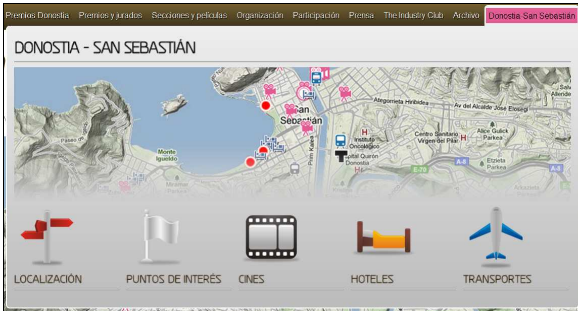
Figura 2. Información de interés para el turista que acude al Festival de San Sebastián