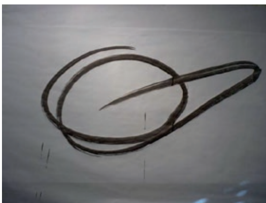
Figura 2. Resultado de la secuencia de movimientos denominada

Teniendo esta dificultad en cuenta, elegimos la secuencia de movimientos denominada “ La cigüeña blanca extiende sus alas ”. Los materiales empleados durante todos los ejercicios fueron brochas, tinta china diluida y papeles de estraza. En este ejercicio Pedro empleó sólo una brocha que manejó con la mano derecha. Seguidamente mostramos el resultado del ejercicio en la figura 1.