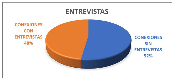
Gráfico 5. Conexiones que incluyen entrevistas

La entrevista en el directo aporta información de primera mano de algún protagonista de la noticia. Estas se dan en una alta proporción, 21 de 44. En cuanto a la dinámica de la entrevista en todos los casos es la misma. Se comienza con un plano americano o general con reportero y entrevistado para pasar en la respuesta a un plano medio del entrevistado. Entonces el cámara se coloca en la posición del reportero, dejándolo en escorzo o únicamente sacando su micro en cuadro. Cuando hay una nueva pregunta a veces se vuelve a reencuadrar para incorporar al reportero en el plano. Al finalizar la entrevista se reencuadra al reportero para su “salidilla”, sacando de cuadro al entrevistado.