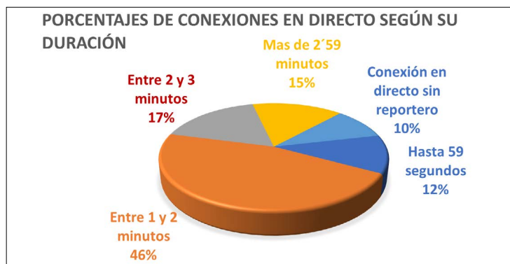
Gráfico 10. Conexiones en directo según su duración

Las 44 conexiones analizadas han sido divididas según su duración, siendo las más numerosas, las de entre 1 y 2 minutos, con 22 directos. Le siguen las de entre 2 y 3 minutos con 9 directos y después las de más de 3 minutos con 7 directos. El último lugar lo ocupan las de menos de 1 minuto con 6 conexiones en directo.