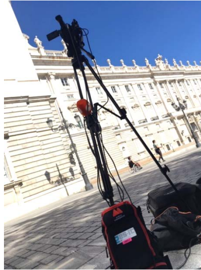
Imagen 1. Dispositivo de cámara y mochila de emisión