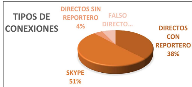
Gráfico 1. Tipos de conexiones

entradilla que simula un directo, pero es seguida de un VTR editado. El objeto de estudio de este trabajo se centra en la conexión en directo, su narrativa, su puesta en escena y su significación en el discurso. En total analizamos 44 conexiones en directo, y descartamos 5 conexiones sin reportero y 8 falsos directos explícitos. Tampoco se analizan las videollamadas que entran por sistema convencional de videoconferencia a las que denominan Skype , (Santana y Sanz, 2021, p. 4), dado que no pertenecen al objeto de nuestro estudio.