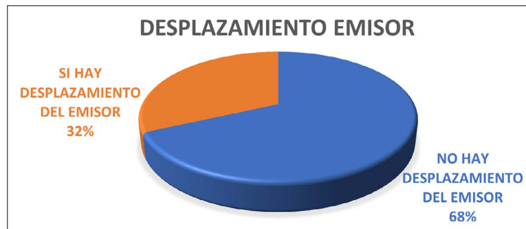
Gráfico 6. Conexiones con o sin desplazamiento del emisor

El desplazamiento del reportero durante las conexiones es uno de los factores que apoyan la tesis de Araceli Infante sobre la importancia del programa de decir, “estoy aquí” (Santana y Sanz, 2021, p. 1), en la calle. Se busca retransmitir el momento, pero también estos desplazamientos ofrecen una espectacularidad que suple la ausencia de acción. En los 14 desplazamientos que hay en todos ellos la naturaleza de la acción objeto del directo es la de valor informativo directo. Del total de desplazamientos, la categoría del directo según el escenario de la acción objeto del directo, el “directo sincrónico” es el más común, 8. Le siguen el presente que se supone y el ilustrativo, 2 cada uno. En cambio, directo arbitrario y contrario solo hay 1 de cada uno.