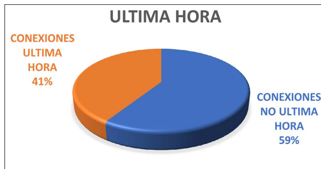
Gráfico 4. Conexiones de “última hora”