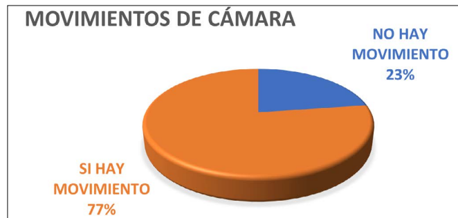
Gráfico 8. Movimientos de cámara

Las tipologías de travelling suelen combinarse entre sí en una misma conexión, formando junto con los paneos coreografías que forman distintas combinaciones. El caso más habitual es el travelling out con el desplazamiento del reportero hacia cámara a medida que relata la noticia y un ligero zoom in que sirve para reencuadrar y pasar de un PA a PML o PM. En ocasiones el paseo del periodista dura toda la conexión y en otras se combina con otros tipos de travelling . En cuanto a combinaciones se da el caso del travelling out hasta un punto final de parada desde donde, a posteriori y en otra dirección, el reportero camina hacia atrás y el operador de cámara le sigue en un travelling in . Esta coreografía es la más habitual. A veces se le añade un travelling de seguimiento lateral o uno circular. En otras ocasiones se añade el travelling lateral o circular al travelling out . El travelling circular se usa para pasar del reportero al escenario de la noticia y acabar de nuevo en el reportero con un entrevistado. El paneo es frecuente tras la entradilla del reportero o en cualquier momento de la conexión para mostrar parte de la escena e incluso algún detalle, donde le sucede un zoom in . Existen conexiones en las que solo aparecen panorámicas y otras en las que la panorámica se combina con travelling . Los zoom in se usan a menudo en los travelling in para acercarnos al emisor o entrevistado, o para ver algún detalle. El zoom out permite pasar de un PA a PML o PM.