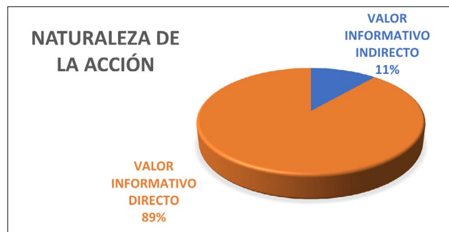
Gráfico 2. Naturaleza de la acción

La naturaleza de la acción de valor informativo directo cubre la mayoría de las conexiones, 39 veces. Estos directos cumplen perfectamente con lo señalado por Mateos (2013), ya que en estos casos el espectador presencia algo que está ocurriendo en ese mismo momento. “Ese es el valor esencial o más puro del directo” (p. 71). Por el contrario, los directos que tienen un valor informativo indirecto son solo 9.