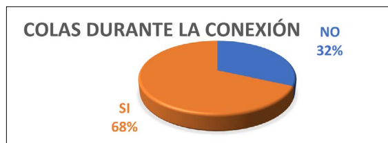
Gráfico 9. Conexiones que incluyen colas

mayoritariamente panorámicas de relación y de seguimiento. En ocasiones cuando hay entrevista las colas desaparecen cuando se abre plano y entra el reportero para preguntar.