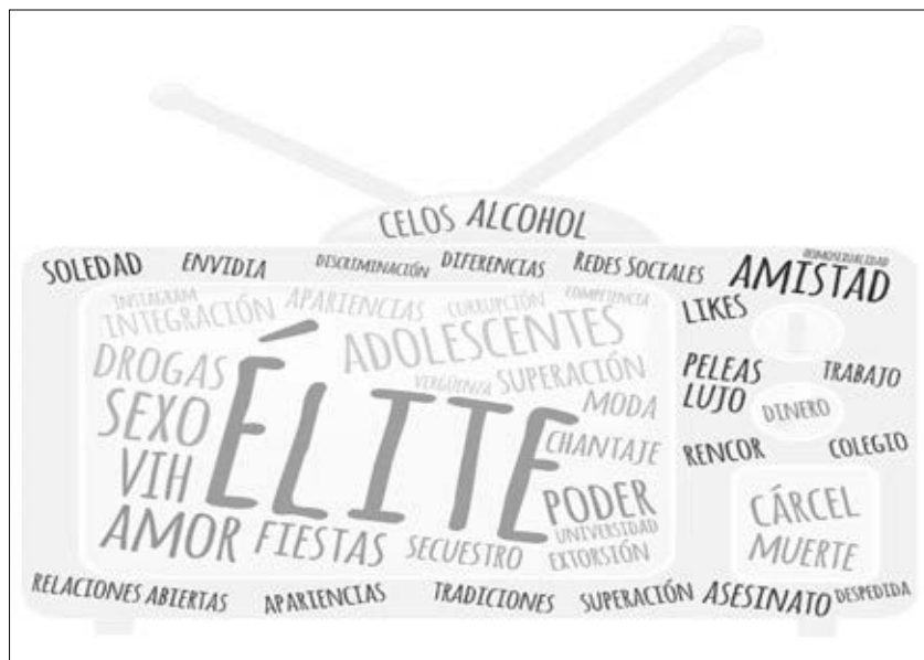
Imagen 1. Nube de palabras con los temas principales de la serie Élite