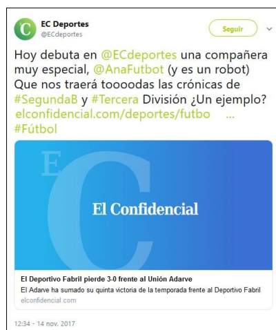
Captura de pantalla de tuit de El Confidencial Deportes. 14-11-2017.