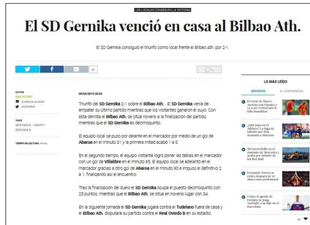
Captura de pantalla. Crónica publicada el 09-02-2019.

El orden de los párrafos, como el que se muestra en la imagen 2, es siempre el mismo: