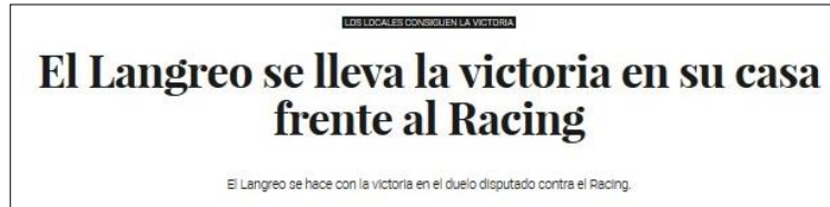
Captura de pantalla del titular de una crónica del 03-03-2019.

Al igual que en el titular, en el subtítulo apenas hay elementos valorativos (TABLA 1). Los dos únicos casos en los que se desprende cierta subjetividad son los referidos a un 1-0 como “un valioso triunfo” y a un 1-1 como “un pobre resultado” para el equipo local. En ambos casos, por tanto, la carga valorativa reside en el empleo de un adjetivo calificativo.