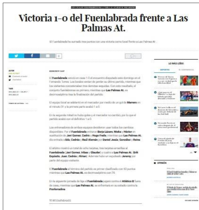
Captura de pantalla. Crónica publicada el 03-03-2019.

Opcionalmente se agregan uno o dos párrafos más a estas crónicas. La decisión aquí es editorial. En principio se presupone que extender la longitud de la crónica va en función de la importancia del partido, pero en realidad el criterio de añadir estos párrafos eligiendo solo unos partidos (esto solo ocurre en 12 de los 80 analizados) y no todos no parece claro, sino más bien aleatorio.