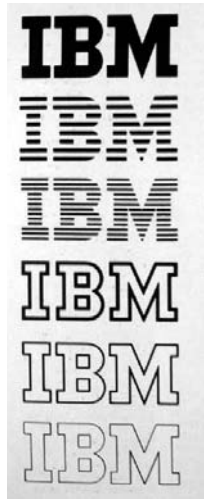
Imagen 3. Distintas versiones del logotipo de IBM