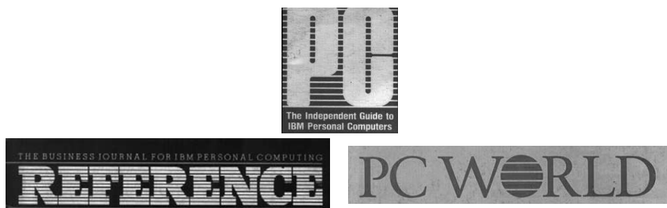
Imagen 5. Revistas americanas en las que la influencia de la imagen de IBM también es palpable: PC (1982), Reference (1983) y PC World (1983).

Para conocer el grado de mimetismo que existe entre la identidad de IBM y las cabeceras de revistas españolas de informática dirigidas a usuarios hemos examinado las primeras publicaciones mensuales referidas a estos contenidos. En profundidad se han revisado los primeros cinco años de la década de los ochenta. Las revistas analizadas son: El Ordenador Personal (1982-1984), Ordenador Actualidad (1982-1983), Panorama de la Informática (1983-1985), Ordenador Popular (1983-1988), Micros/Chip (1983-1992), B Computer (1983-1985), Bip-Bip el Amigo de tu Ordenador (1984-1986), Tu Micro (1984-1985) y PC World (1985-). Muchas de ellas tienen acuerdos de colaboración con revistas hermanas en otros países: Ordenador Personal ( L'Ordinater Individual – Francia), El Ordenador Popular ( Popular Computing y Byte – Estados Unidos), Micros (Chip - Alemania) y PC World ( PC World – Estados Unidos). Los proyectos propiamente españoles son: Ordenador Actualidad , Panorama de la Informática , Bip-Bip el Amigo de tu Ordenador , B Computer y Tu Micro . A partir de 1985 nos hemos acercado sólo a los proyectos gráficos que imitaban la imagen de IBM .