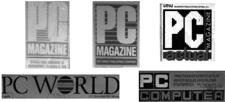
Imagen 6. Cabeceras de revistas españolas de informática de usuarios influenciadas por el logotipo de IBM: Bip-Bip (1984), PC Magazine (1985), PC Magazine (1988), PC Magazine Actual (1988), PC World (1985), PC Computer (1986) y PCompatible (1987).

Anotar que las revistas especializadas en informática dirigidas a usuarios que responden a proyectos editoriales españoles tuvieron una presencia más efímera en el mercado. La vida de estas publicaciones, en el quiosco, no supera los tres años, excepto Tu Micro que se mantiene cinco años, tras los sucesivos cambios de cabecera: Tu Micro Personal (1986) y Revista de Micro Informática Personal (1987-1988). Sin embargo, las publicaciones respaldadas por cabeceras o grupos internacionales persistieron más años en el quiosco.