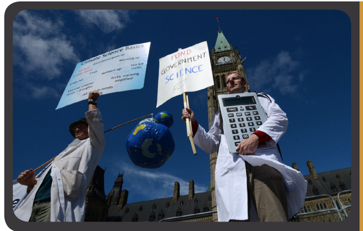
figura del comunicador científico adquirió perfiles profesionales.

Algunos autores han señalado una paradoja en todo este proceso y es que al mismo tiempo que la ciencia fue aumentando su importancia como dinamizadora de la economía –la economía del conocimiento es fruto de tiempos recientes- esto produjo algunos efectos contrarios a la transparencia reclamada, ya que favoreció el secreto y la apropiación del conocimiento por parte de empresas.