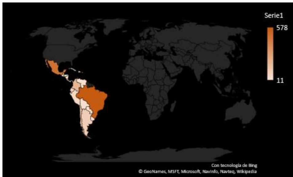
Imagen 2. Mapeo por países de la producción científica.

A continuación, se hizo un mapeo tomando el total de los artículos por cada país (imagen 2).