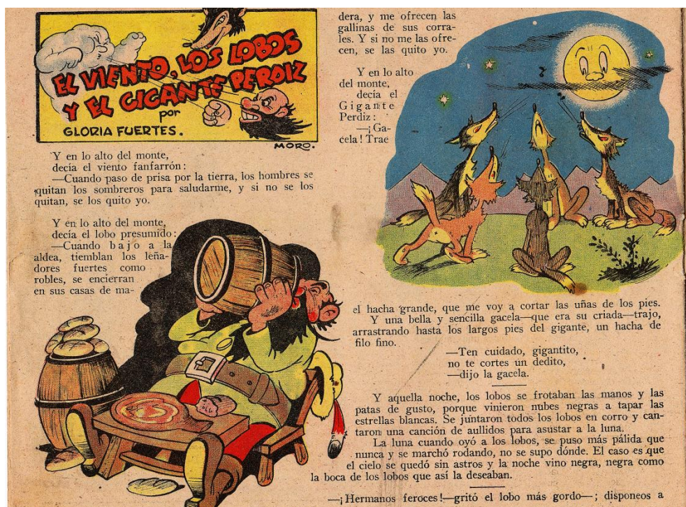
Figura 4. “El viento, los lobos y la gigante perdiz” de Gloria Fuertes con ilustraciones de Moro. Maravillas , nº 297, 17 mayo 1945, p. 1.

diversas producciones de los dos artífices confirieron un carácter innovador e interdisciplinar a los contenidos del suplemento. Para ello el empleo del humor sutil y la ironía de vuelo satírico tanto en el texto literario como en las imágenes, en una suerte de écfrasis , resultó crucial [27], puesto que suponían, en fin, un marcado distanciamiento estético con respecto al relato de corte moral imperante en Flechas y Pelayos . Además, desde este mismo prisma interdisciplinar, la escritora madrileña colaboró también con otros destacados artistas de la época, especialmente con Moro, quien ilustrase cuentos como “El viento, los lobos y el gigante perdiz” publicado en 1945 (Ver Figura 4).