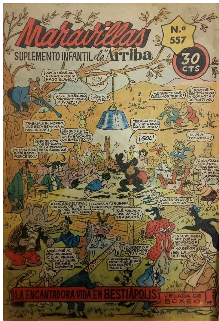
Figura 3. Portada de Maravillas como Suplemento de Arriba , tercera época, n° 557, enero de 1951, p. 1.

precio que variaba desde los diez céntimos del 24 de agosto de 1939 hasta el número 89, de finales de mayo, cuando aumentó a veinte céntimos. En fin, con unas dimensiones variables, la primera edición presentaba un formato de 21 x 17 cm., y una paginación en torno a dieciséis páginas no numeradas. Sin embargo, el soporte experimentó transformaciones y cambios a lo largo de su azarosa existencia pasando a denominarse, eso sí, Suplemento Escolar de la revista Mandos a partir del número 357, con data del 7 de octubre de 1945, y funcionando como suplemento dominical del diario nacional Arriba (Ver Figura 3) [25].