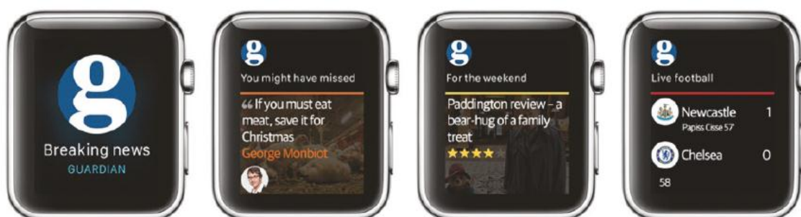
Imagen 2. App para iWatch del diario The Guardian

La aplicación de El País también se suma a la tendencia de la lectura rápida de titulares en la muñeca. Su estrategia de difusión se centra en seleccionar las cinco piezas más destacadas del momento en la web. Para leerlas con mayor profundidad, el usuario puede guardarlas como favoritas o abrirlas directamente en el iPhone para su lectura detallada a través de la pantalla del smartphone. Al estar sincronizado con el teléfono, el reloj muestra de manera automática las notificaciones y alertas informativas que recibe regularmente el teléfono móvil. El diario El País incorpora las glances (miradas) con el fin de ofrecer píldoras informativas que se incluyen en la parte principal del reloj para una consulta rápida.