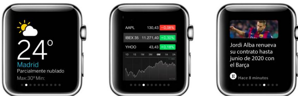
Imagen 3. App para iWatch del diario El País

El Mundo , Le Figaro y Le Monde , pensando en las características de esta nueva pantalla, optan por ofrecer exclusivamente títulos y subtítulos. Contemplan la opción de continuar con la lectura en el iPhone o de guardar la información para su consulta posterior.